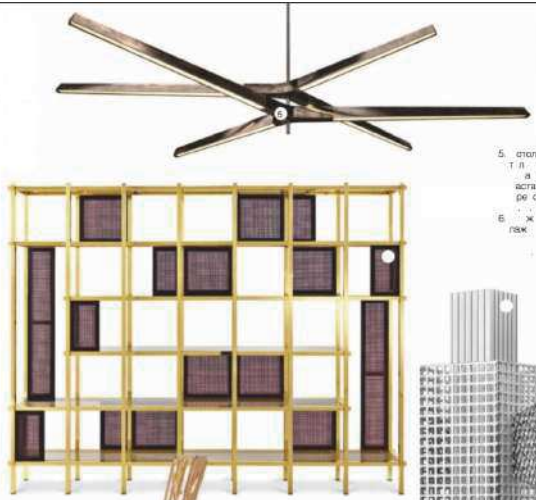
Тренд: металл в интерьере

5. стеновые панели Текстурированный металл 6. решетчатые конструкции