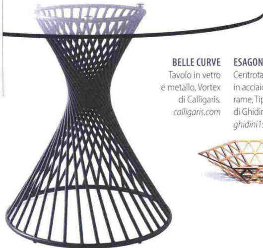
BELLE CURVE Tavolo in vetro e metallo, Vortex di Calligaris. calligaris.com ESAGONALE Centrotavola in acciaio color rame, Tip Top di Ghidini 1961. ghidini1961.com

Tradizione e innovazione si incontrano, per uno stile fatto di pezzi cult, rielaborati in chiave contemporanea