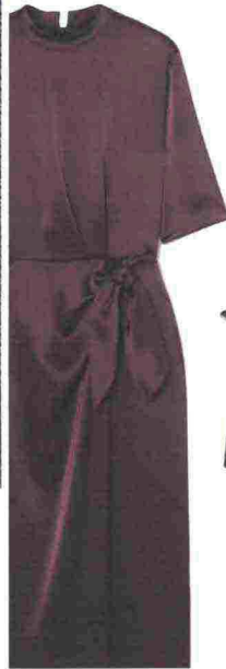
ELEGANTE Abito in satin, Nanushka. nanushka.com