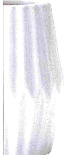
IRREGOLARE Vaso in ceramica, Nkd. nkd.com