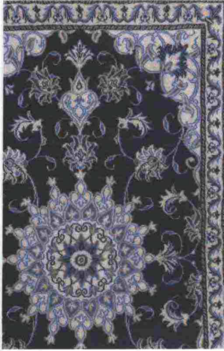
PREZIOSO Tappeto annodato a mano, Persisk Nain di Ikea. ikea.com