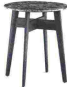
VARIEGATO Tavolino con piano in marmo, Bigger di Poliform. poliform.it