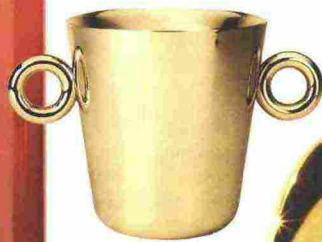
Secchiello champagne "Double O" GHIDINI 1961 1.360 euro.