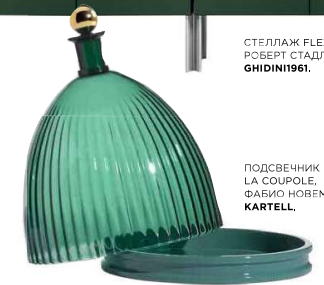
ПОДСВЕЧНИК LA SOUPOLE, ФАБИО НОВЕМБРЕ, KARTELL .