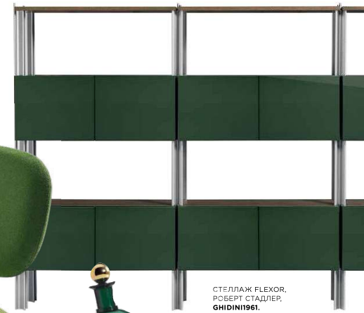
СТЕЛЛАЖ FLEXOR, РОБЕРТ СТАДЛЕР, GHIDINI1961 .