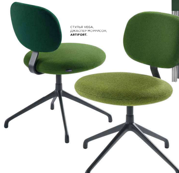
СТУЛЬЯ VEGA, ДЖАСПЕР МОРРИСОН, ARTIFORT .

Тона шалфея, мха, оливы и сосновой хвои в актуальных коллекциях Миланского салона — дань биофильным тенденциям, подкрепленным верой в научный прогресс. Пока исследователи заняты изобретением новых материалов и способов контроля канмата внутри и вовне, человечество пытается из цифрового эдема вернуться к объективной реальности, где можно любоваться рисунком камня, смотреть на воду и изучать узоры листьев, что оказывается не менее ценным.