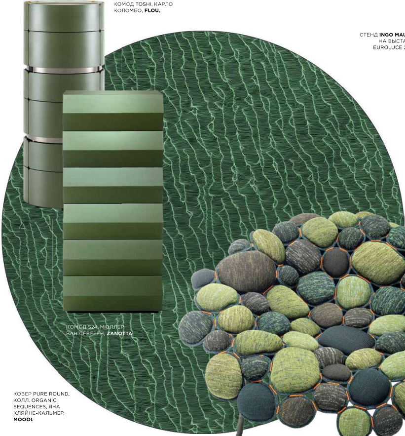
КОМОД S24, МЮЛЛЕР ВАН СЕВЕРИ, ZANOTTA .