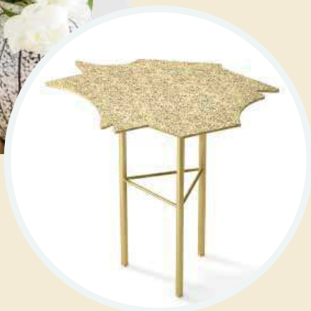
Stolek Le Ninfee, Alessandro Mendini