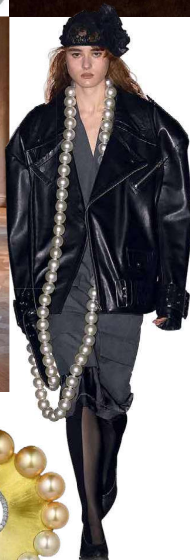
ОБРАЗ С ПОКАЗА БРЕНДА VAGUERA, ОСЕНЬ-ЗИМА 2025.