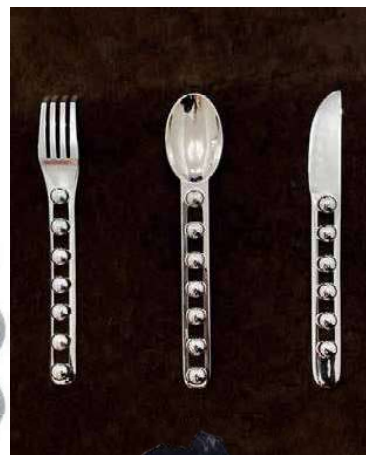
НАБОР СТОЛОВЫХ ПРИБОРОВ SEVEN BALL, JESSI BURCH. ЛАТУНЬ, СЕРЕБРО.