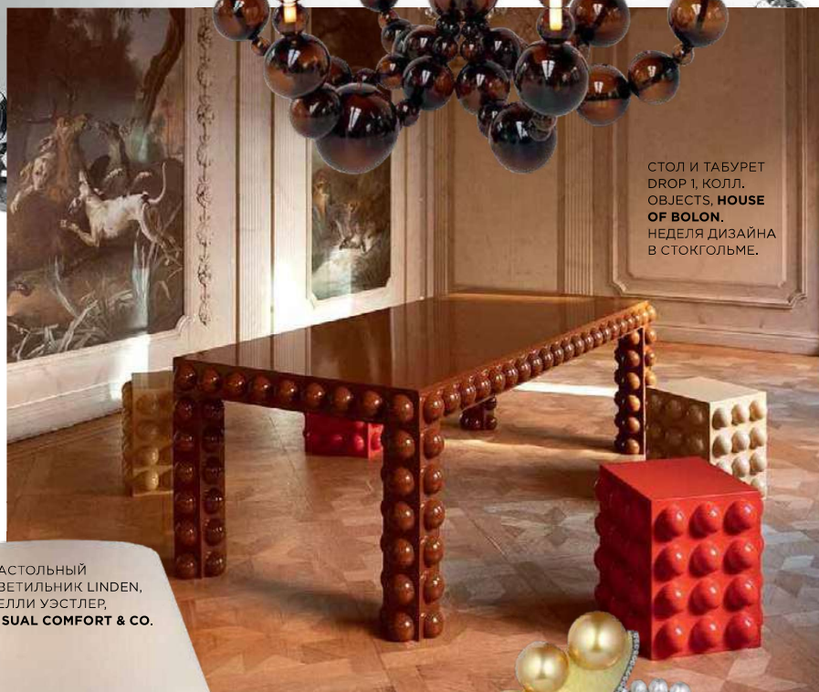
СТОЛ И ТАБУРЕТ DROP 1, КОЛЛ. OBJECTS, HOUSE OF BOLON. НЕДЕЛЯ ДИЗАЙНА В СТОКГОЛЬМЕ.