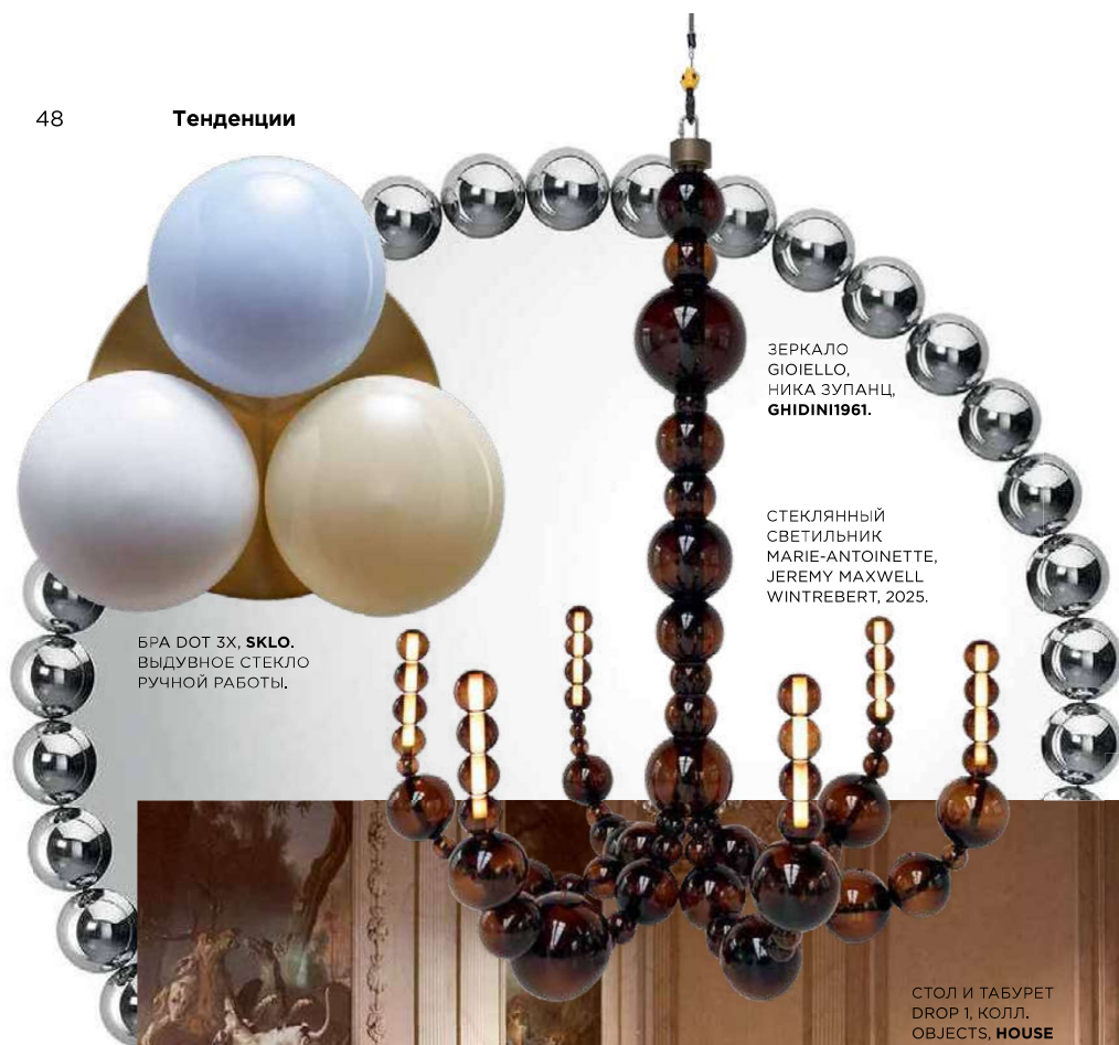
БРА DOT 3X, SKLO. ВЪДУВНОЕ СТЕКЛО РУЧНОЙ РАБОТЫ.