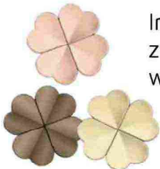
Wünsch Dir was: Kleiderhaken „Lucky“ aus Leder (ghidini1961.com)

Im Rahmen der diesjährigen Mailänder Möbelmesse zeigten auch diverse Food- und Lifestyle-Brands, wie vielfältig Design sein kann