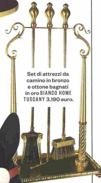
Set di attrezzi da camino in bronzo e ottone bagnati in oro BIANCO HOME TUSCANY 3.190 euro.