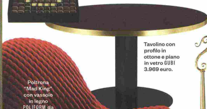
Tavolino con profilo in ottone e piano in vetro GUBI 3.969 euro.