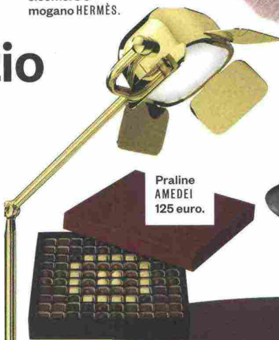
Praline AMEDEI 125 euro.

Se fino all'inverno scorso ci piaceva rintanarci in casa al tramonto, con le mani intirizzite dal freddo, sognando solo la poltrona preferita e una tazza di tè, ora che tra le quattro mura siamo obbligati a stare, che fatica ritagliarci veri momenti di relax! Tra didattica a distanza, smart working e lezioni di pilates on line è una corsa contro il tempo (libero). Perché allora non concederci un angolo dedicato al dolce ozio, dove ripararci anche dalle intemperie della vita? L'imperativo è staccare e accomodarsi in poltrona con il necessario per il bien vivre : una scatola di cioccolatini assortiti («Non sai mai quello che ti capita», diceva la mamma di Forrest Gump), una scacchiera in legno magari un po' modaiola, un camino che emani luce e calore e finalmente il romanzo che da mesi attende di esser letto. Il clima si fa ancora più rilassante se ai nostri piedi c'è un simpatico cagnolino, ma non di quelli da portare a passeggio. Fuori fa freddo.