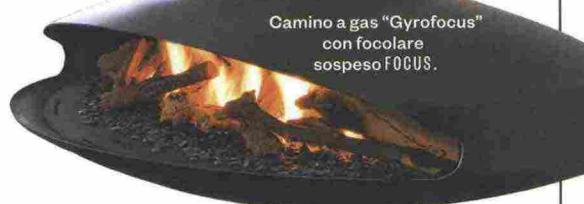
Camino a gas "Gyrofocus" con focolare sospeso FOCUS.