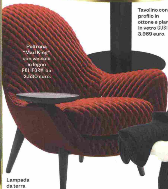
Poltrona "Mad King" con vassoio in legno POLIFORM da 2.530 euro.