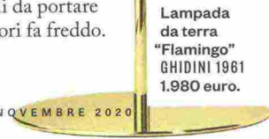
Lampada da terra "Flamingo" GHIDINI 1961 1.980 euro.