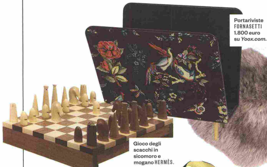
Portariviste FORNASETTI 1.800 euro su Yoox.com.