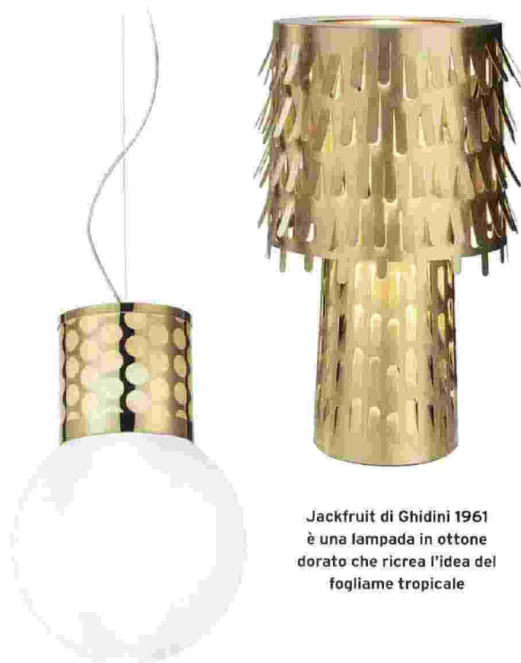
Jackfruit di Ghidini 1961 è una lampada in ottone dorato che ricrea l'idea del fogliame tropicale