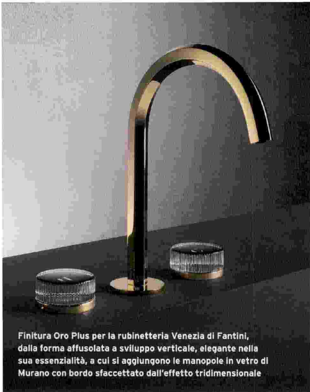
Finitura Oro Plus per la rubinetteria Venezia di Fantini, dalla forma affusolata a sviluppo verticale, elegante nella sua essenzialità, a cui si aggiungono le manopole in vetro di Murano con bordo sfaccettato dall'effetto tridimensionale